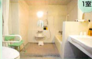
ハンディキャップルーム(37.18㎡)