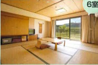
和室(12.5畳).....2室 和室(10畳).....4室