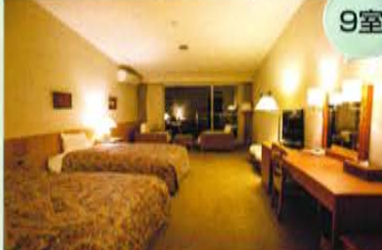
デラックスツインルーム(41.58㎡)