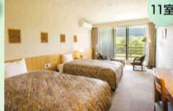
スタンダードツインルーム(37.18㎡)