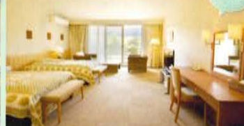
スペシャルルーム(44.78㎡)